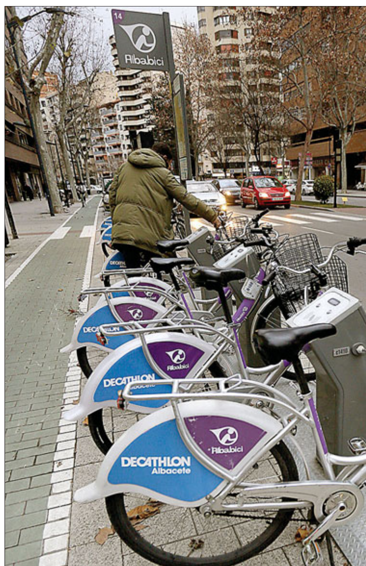
Se prevén mejoras en el carril bici de la ciudad.

En su propuesta, el Grupo Ganemos manifestó que existen demasiados «puntos negros» en la ciudad que hay que corregir porque provocan la falta de continuidad, intersecciones no resueltas, acumulación de mobiliario urbano que entorpece la circulación, interferencias con terrazas o falta de visibilidad, entre otros obstáculos.